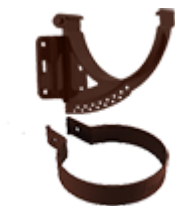
Аксессуары для водосточных систем