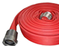
Шланги для пожарных кранов