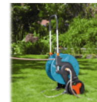
Катушки для шлангов