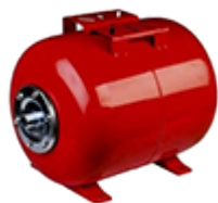
Гидроаккумуляторы к насосам