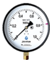
Манометры для газа, воды