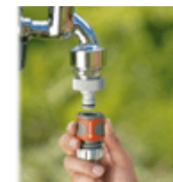
Коннекторы для шлангов