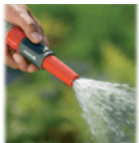
Насадки для шлангов