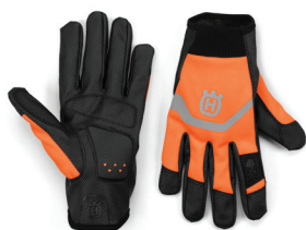
RUKAVICE FUNCTIONAL LIGHT NON-SLIP 529 88 02-07