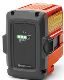
AKUMULÁTOR HUSQVARNA BLI20 967 09 17-01