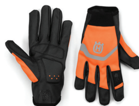
RUKAVICE FUNCTIONAL LIGHT NON-SLIP 529 88 02-10