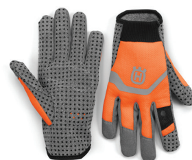
RUKAVICE FUNCTIONAL LIGHT VENT 529 88 01-07