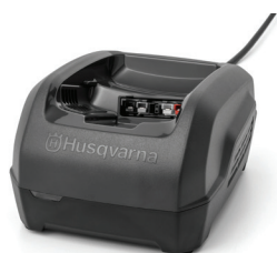
NABÍJEČKA HUSQVARNA QC250 967 97 01-01