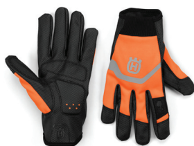
RUKAVICE FUNCTIONAL LIGHT NON-SLIP 529 88 02-09