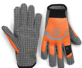
RUKAVICE FUNCTIONAL LIGHT VENT 529 88 01-09