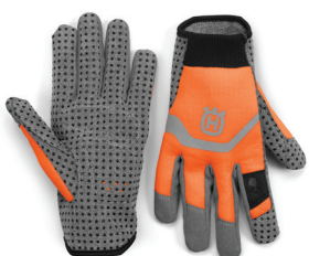
RUKAVICE FUNCTIONAL LIGHT VENT 529 88 01-08