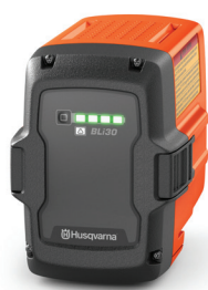
AKUMULÁTOR HUSQVARNA BLI30 967 93 77-01