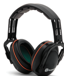
CHRÁNIČE SLUCHU 505 66 53-04