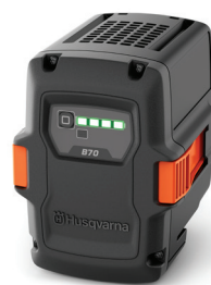
HUSQVARNA 40-B70 970 45 71-01