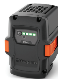
HUSQVARNA 40-B140 970 45 72-01