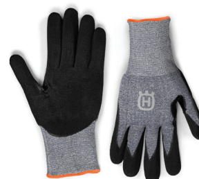
RUKAVICE TECHNICAL GRIP 529 88 03-07