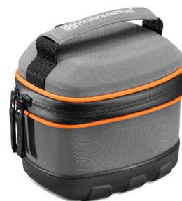
OBAL NA AKUMULÁTOR HUSQVARNA 585 37 18-01