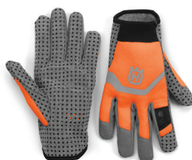
RUKAVICE FUNCTIONAL LIGHT VENT 529 88 01-10