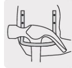
Gancho de acero para martillo